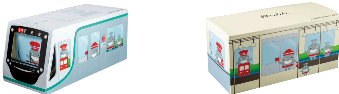
▲「のるるん焼 東急線 電車箱」（左：外箱、右：内箱）

※ 2月23日・24日は、「のるるんコラボレーショングッズ発売記念鉄道イベント」開催のため「のるるん焼」のみの販売となり、「薄皮たい焼」と「クロワッサンたい焼」の販売を休止します