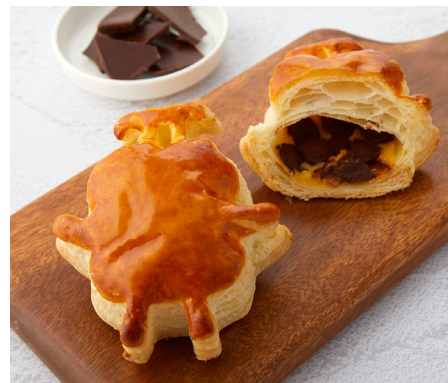
▲ 新商品「のるるんパイ」

当施設では、限定商品を開発・販売することで地域の皆さまに喜んでいただきたいという思いから「のるるん」と出店店舗のコラボレーションを実施しています。第1弾は、「のるるん」誕生10周年を記念して＜薄皮たい焼 銀のあん たまプラザ テラス店＞と開発した「のるるん焼」、第2弾は＜靴下屋 たまプラザ テラス店＞で「のるるんくつした」を数量限定販売しました。第3弾となる今回は、＜神戸屋フォーニル レザンジュ たまプラザ テラス店＞限定で「のるるんパイ」を販売。「のるるん」をかたどったサクサクのパイ生地の食感と、甘さ控えめにしたチョコレートとカスタードの相性が抜群です。また、3店舗での「のるるん」コラボレーショングッズ新発売を記念した鉄道イベントでは、「のるるん」との写真撮影会やミニトレイン乗車などさまざまな企画を用意しています。