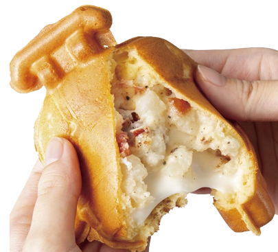
▲「のび～るチーズのベーコン&ポテト」味