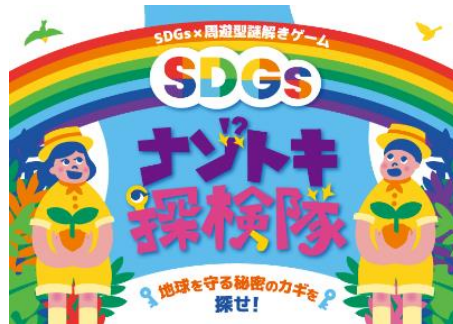
▲謎解きイベントイメージ