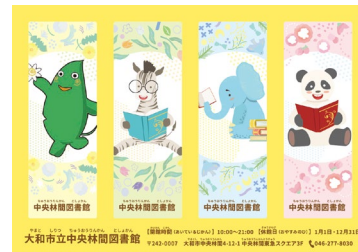
▲ オリジナルグッズ