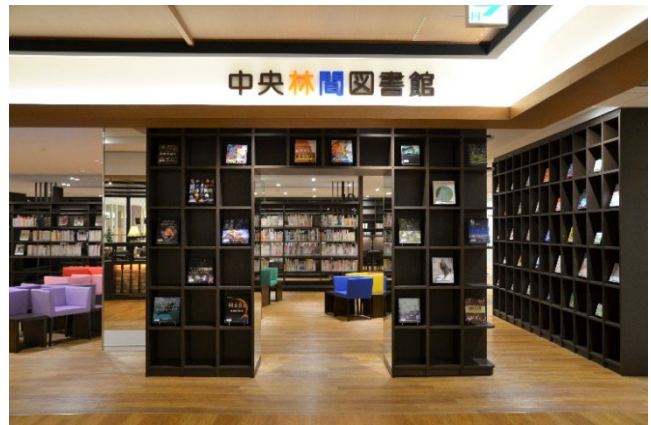
▲ 大和市立中央林間図書館

大和市は、図書館を中心としたまちづくりや子育て支援などに取り組み、「健康都市 やまと」の実現を目指しています。商業施設運営を通じてサステナブルなまちづくりを推進する当社は、大和市立中央林間図書館と、夏休み期間中の来館促進施策として、昨年「中央林間図書館に行こう！わくわくスタンプラリー（以下：本企画）」を共同開催しました。子どもたちが楽しみながら読書をするきっかけづくりや、本に触れる機会を増やす場を提供し、ご好評いただいた本企画を今年も実施します。