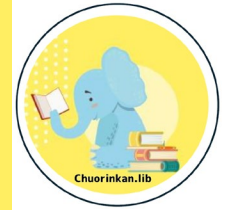
▲ オリジナルノート（左）、 オリジナル缶バッチ（右）