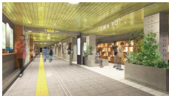
▲駒沢大学駅リニューアルイメージ(コンコース)