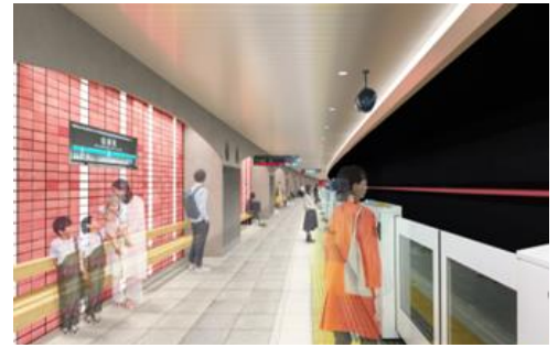
▲桜新町駅リニューアルイメージ(ホーム)