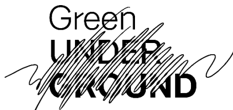
▲「Green UNDER GROUND」ロゴ

公式Instagram: https://www.instagram.com/gug_5stations?igsh=ZWNlbWl3dmE2czRo