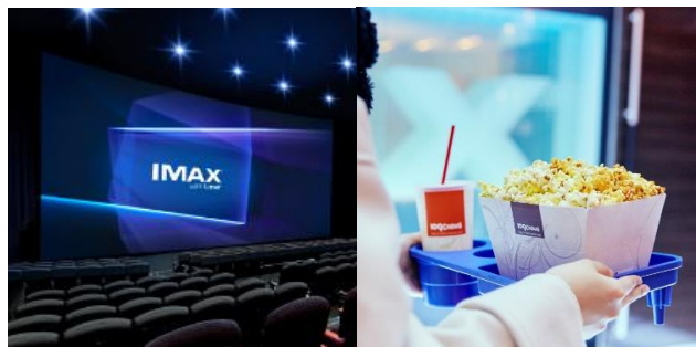
109シネマズ二子玉川