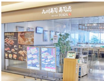
九州寿司 寿司虎 Aburi Sushi TORA

コロナ明けに伴う外出需要の高まりにより、各業種の売上高は順調に向上しました。リモートワークからオフィス復帰が進んだことや、冠婚葬祭などオナーションの回復によるアパレルの販売が好調だったことに加え、スポーツ、アウトドアブランドも売上高向上を牽引しました。また、飲食店の稼働率や、アルコール需要の回復に伴う客単価の向上により、「九州寿司 寿司虎 Aburi Sushi TORA」などの飲食店売上高も好調でした。サービスでは、「109シネマズ二子玉川」や「PLAY! PARK ERIC CARLE」などの体験型店舗のほか、旅行需要の拡大に伴い「エイチ・アイ・エス」が売上高を大きく伸ばしました。