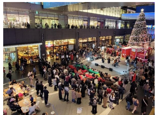
「二子玉川ライズ クリスマス2023」の様子

2023年度は、二子玉川ライズ各所において、食・スポーツ・芸術などを通して、ここだけの上質な体験を提供する約180回ものイベントを開催。イベントの開催数や規模をコロナ禍前の水準に戻せたことにより、来館者数が増え、売上高向上に寄与しました。特に、フोटスポットやARコンテンツ、スケートガーデンなどの体験を盛り込んだ「二子玉川ライズ クリスマス2023」は多くの方に来場いただいた他、屋内で涼みながら楽しめる夏休みイベント「ふたご祭」では来場者数が約3万人にのぼるほどの好評をいただきました。「二子玉川ライズ・ドッグウッドプラザ」、「玉川高島屋S・C」との3施設による合同イベント「二子玉川ハロウィンパーティー」や、「リコーブラックラムズ東京 2023-24シーズン出陣式」など、地域との連携イベントも積極的に実施しています。