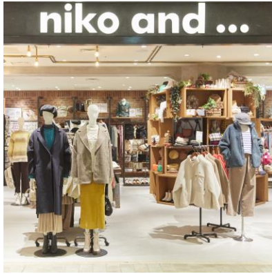
ニコアンド/ニコアンド コーヒー

タウンフロント 4Fは、「Daily use 訪れる人々の日常に寄り添うフロア」をテーマに、2022年10月28日にリニューアルオープンし、全5店舗の新店・リニューアル店舗が登場しました。フロア初となるカフェ「ニコアンド コーヒー」を併設したアパレル・雑貨ブランド「ニコアンド/ニコアンド コーヒー」や、美容と健康をテーマにしたコスメセレクトショップ「アインズ&トルペ」が新たにオープンし、ソックス・インナーの人気店「チュチュアンナ」が内装も新たにリニューアルするなど、いつも立ち寄りたくなる楽しいフロアへと生まれ変わったことが要因で、フロア全体の売上高が前年比 123.7%を記録しました。