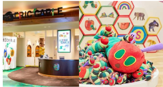
PLAY! PARK ERIC CARLE