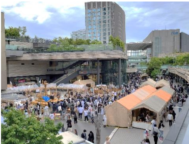
イベント「太陽と星空のサーカス」の様子

二子玉川ライズ S.C.では、開業10周年を迎えた2021年より、次の10年に向けた施設運営の基本方針として、単なる買い物の場から、多様なステークホルダー（商業テナント、地元町会・商店会、行政、企業、学校など）を巻き込み、人と人、来館者とステークホルダーをつなぐ、二子玉川エリアの新しい「コミュニティ・プラットフォーム（＝次世代のショッピングセンター）」としての役割を担うことを目指しています。開業以来大切にしてきた「上質な日常」を提供できるよう、高感度かつ希少性の高いブランドの積極的な誘致や体験型MDを具現化する店舗の展開を進めてまいりました。二子玉川らしい新しい価値を提供し、商品を手にとる喜びを感じることができる売り場づくりをしています。