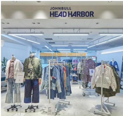
ジョンブル ヘッド ハーバー