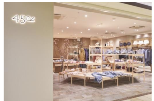
フォーティファイブ・アール