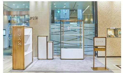
プロモーションスペース「ミライズ。」

タウンフロント 1F インフォメーションセンター前に、店舗出店、既存店支援、販促施策を主として、マーケティングやプロモーションを目的にご利用いただけるスペースを設置しました。什器を用意するなどテナントが利用しやすいような工夫を行っており、多様なコンテンツ展開が可能です。