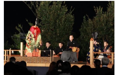
「二子玉川ライズ新能」の様子（2022年撮影）

【特設サイト】 https://www.rise.sc/eventnews/detail/?cd=000890