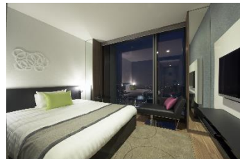
スーパーリアダブル