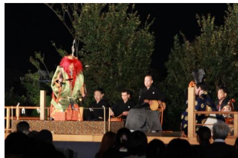
「二子玉川ライズ薪能」の様子（2022年撮影）