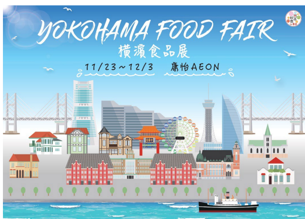
▲ 「YOKOHAMA FOOD FAIR」 キービジュアル

TMDHK は、香港において積み重ねてきた知見を生かし、香港進出を検討する日本国内企業に対し、店舗開発業務から運営オペレーションまで幅広い業務支援を提供しています。今後も各企業のニーズに合わせた支援スキームにより、日本ブランドの香港進出を支援してまいります。