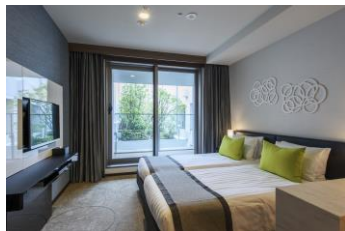
スタンダードツイン

https://www.rsv.tokyuhotels.co.jp/cgi-bin/ihonex/stay/search_category.cgi?hid=r_TE_FUTAK&search%3Ahid=r_TE_FUTAK&plan_groupcd=IBNCM0&search=1&form=jp