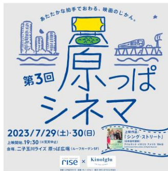
▲第2回「原っぱシネマ」（2022年開催）の様子 ▲第3回「原っぱシネマ」キービジュアル

今年で3回目の開催となる「原っぱシネマ」は、「都心にありながらオープンエアの自然豊かな開放感あふれる施設」という「二子玉川ライズ」の施設の特長を最大限生かした屋外シネマイベントです。去年は多くのお客さまにご応募いただき、抽選は両日ともに高倍率で大変好評でした。