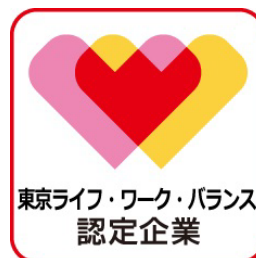
▲ (上) 認定企業交流会の様子 (下) 東京ライフ・ワーク・バランス 認定企業ロゴ