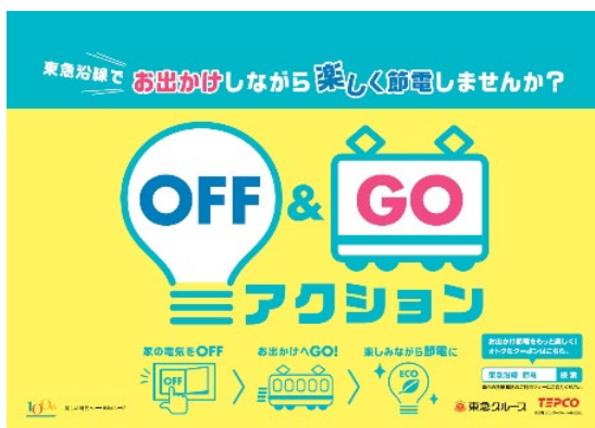
▲プロジェクト告知イメージ