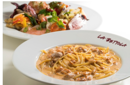
「ラ・ベットラ・ダ・オチアイ カナザワ」 料理イメージ