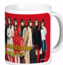
デニムミニトートバッグ+マグカップ 2 個セット