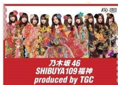
ビジュアルパネル