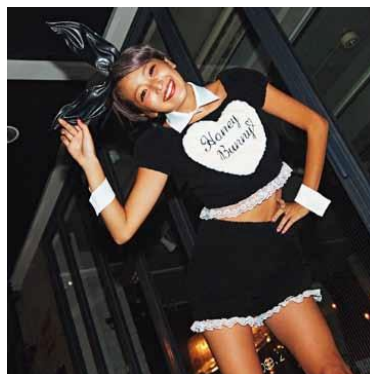
7F Honey Cinnamon