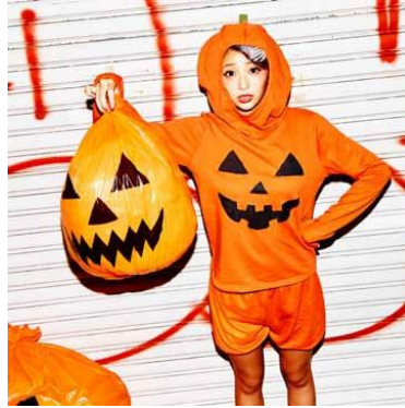
3F PEACH JOHN