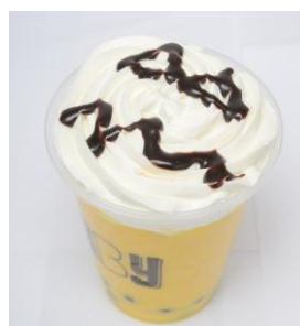
ジャック・オー・パンプキン ¥410(税抜き) SBY (8F)