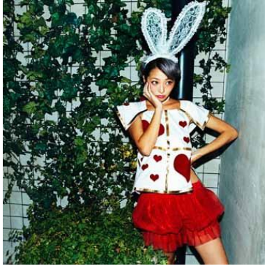
2F Ruby to be!