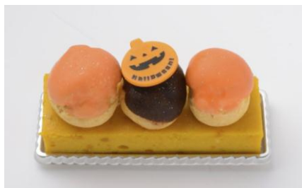
ジャック ¥480(税抜き) café Ma Maison (7F)

7Fの「カフェ マ・メゾン」と8Fの「SBY」ではキャンペーン期間中のみ、ハロウィンならではのかぼちゃを使ったスイーツを販売します。